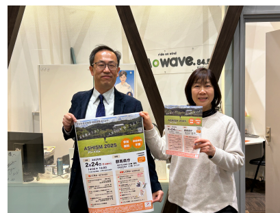
写真9 前橋市Mサポゆるつな参加&出店