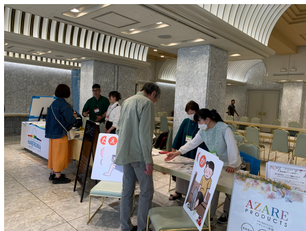
写真3 JSPEN（日本栄養治療学会）関東甲信越地方会