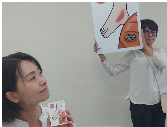
写真5 希望館病院主催健康フェスタ