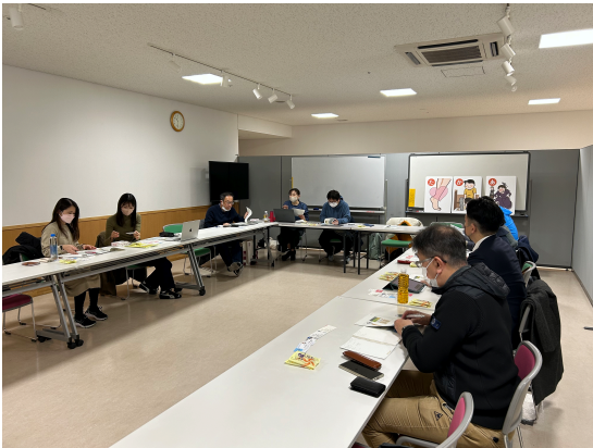
写真8 Mwave むーちゃんラジオ